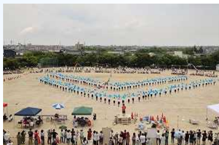
令和3年度運動会での6年生集団演技「Do your Best!」 かっこええわ〜!